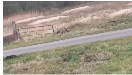
Figuur 3 Wolf in Drenthe, Zweeloo 2015

Zowel in Sleen als in Coevorden is er grote onrust over de eventuele aanleg van Padelbanen in de buitenlucht. Tennisverenigingen zien hier een nieuwe model in om jongeren te interesseren voor deze sport. Deze kruising tussen tennis en squash gaat overigens met veel geluidsoverlast gepaard. Onze fractie begrijpt de weerstand bij omwonenden. De fractie is met bezwaarmakers goed in gesprek. Wij zien Padel toch vooral als een sport in de buitenlucht op grote afstand van de bebouwde omgeving of als indoorsport. Omdat er geen landelijk beleid is maar deze wel binnen een maand beschikbaar komt vinden we dat het college alle aanvragen moet aanhouden. Of dat ze met een voorstel komt voor nieuw, lokaal beleid.